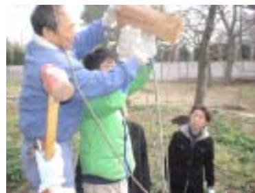
2月。新しく栗の苗木を植え込みました。竹の支柱も竹林から伐採し、手作りの作業を体験

武蔵野の面影を残す小金井ですが、屋敷林などの緑地は年々少なくなりつつあります。この貴重な緑地を少しでも残していくため、小金井市梶野町の緑地をお借りして、農作業の体験や緑に親しみながら、花を育て、緑地の環境を生かしていく活動を進めています。