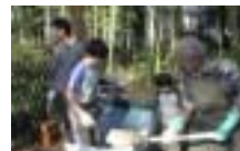
12月: ぼかし肥料づくり