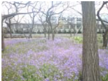
3月下旬。緑地一面にムラサキハナナの花が咲きました。