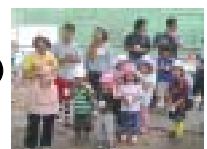
保育園児も種まきに参加