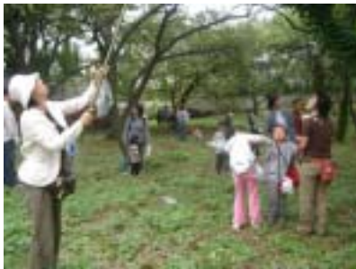
秋の栗拾いの様子。竹林から切り取ったばかりの竹竿を使って、栗の実を落として拾います。