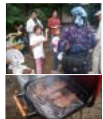
栗の試食とバーベキュー