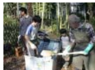
ぼかしづくりの様子。