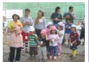
保育園児も種まきに参加