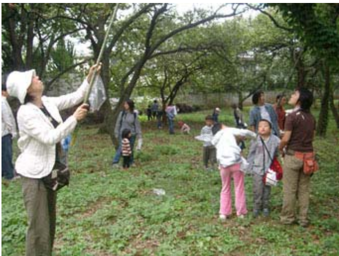
秋の栗拾いの様子。竹林から切り取ったばかりの竹竿を使って、栗の実を落として拾います。