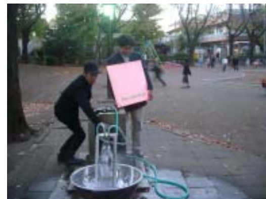
雨水発電実験の様子。 水車が見事に回って発電成功！