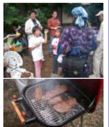
栗の試食とバーベキュー